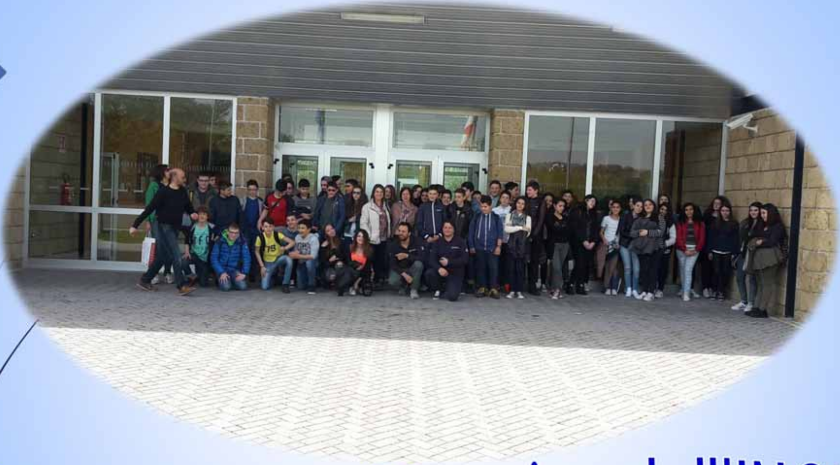
Foto con lo staff tecnico dell'INGV