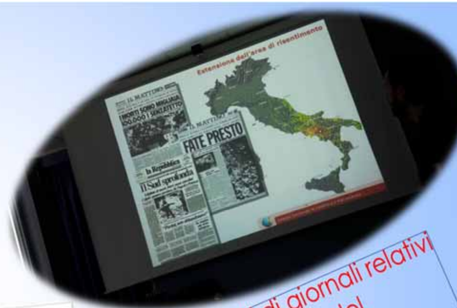
Articoli di giornali relativi al terremoto del 23 novembre 1980